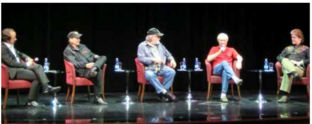
© Dennis Jale, Willi Flach, Franz Katterbauer